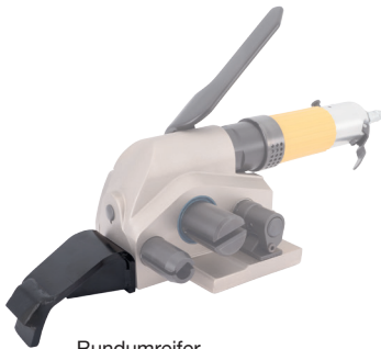
Rundumreifer Round bundler