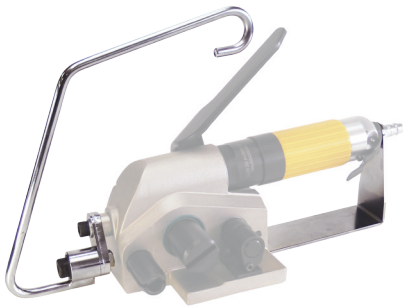
Aufhängebügel / Handschutzbügel Hanger bow / hand protection bow